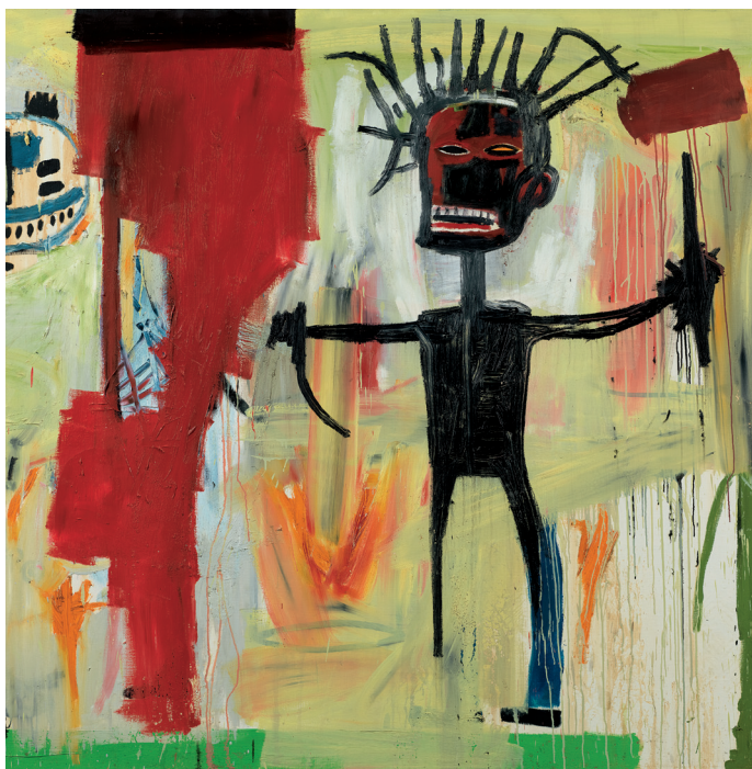
Jean-Michel Basquiat, Self Portrait [detalle], 1986. Colección MACBA. Depósito de la Generalitat de Catalunya. Antigua Colección Salvador Riera. Licencia de Artestar, Nueva York.