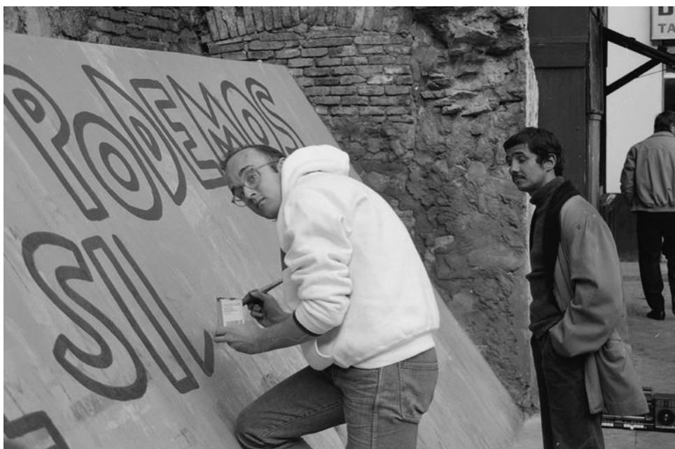
Keith Haring fent el mural Tots junts podem parar la sida , 1989.

Tanmateix en aquesta ocasió la idea d'Arxiu concebuda pels impulsors, l'Equipore -plataforma d'investigació i producció formada per Aimar Arriola, Nancy Garín i Linda Valdés- vol mantenir-se com una proposta activa i viva , i no concebre's com un mer punt dipositari. Així doncs l'exposició comptarà amb un grup d'estudi actiu que generarà materials i peces complementàries , en relació amb els agents de la ciutat de Barcelona.