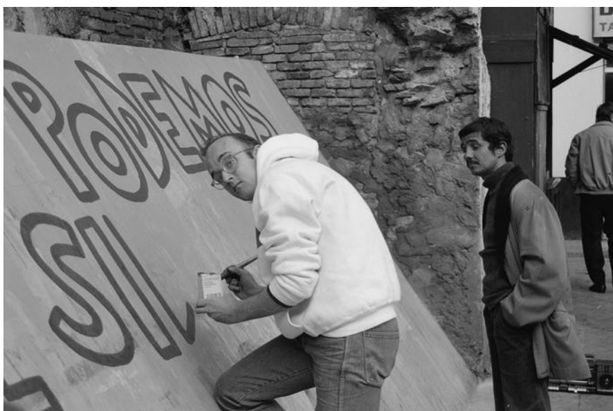
Keith Haring realizando el mural Todos juntos podemos parar el sida , 1989.