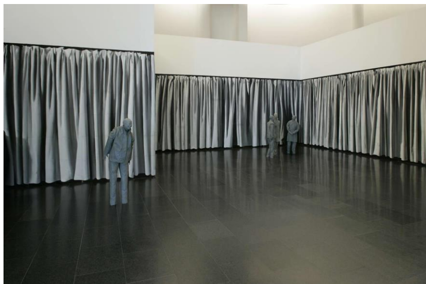
Juan Muñoz, The Nature of Visual Illusion , 1994-1997

Mentre les polítiques de la identitat continuaven influïnt l'art en començar la dècada dels noranta, quan encara es negociava el llegat del minimalisme i la seva tendència a defugir tot el que fos personal, els artistes van començar a treballar amb escenografies i instal·lacions a gran escala d'una manera que, malgrat les referències al minimalisme, explorava temàtiques d'un alt contingut personal o polític. Les al·lusions al cos sovint s'expressaven a través de la seva absència, o mitjançant attrezzo, pròtesis i accessoris que servien per modificar-lo, o mitjançant mobles o altres objectes que podien substituir-ne una part o el cos sencer.