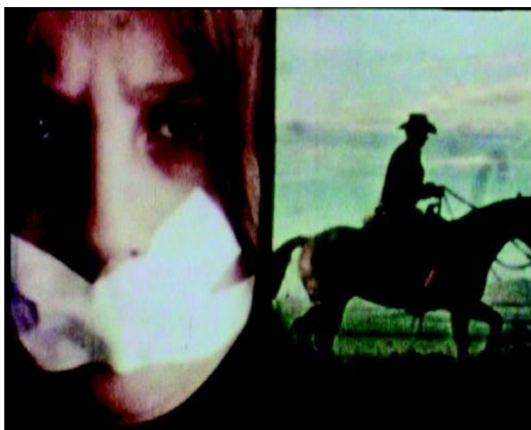
Eugènia Balcells Boy Meets Girl , 1978 Pel·lícula 16 mm transferida a vídeo, color, so, 9 min 13 s Ed. 1/7 Col·lecció MACBA.

A finals dels anys seixanta i durant els setanta es va produir l'eclosió d'una nova era de feminisme radical i activisme feminista, en un marc més ampli de contracultura o moviments antisistema, que va adoptar formes diferents arreu del món. Aquesta lluita feminista es troba a la base de l'obra d'una multitud de dones artistes, o fins i tot en un context social determinat. N'hi ha moltes que van recórrer a la cosificació de la dona en l'art més convencional i en els mitjans de comunicació, així com a la creació i difusió d'estereotips femenins per part de la publicitat, per denunciar el paper subaltern de la dona en la societat.