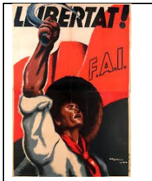
Carles Fontserè, Llibertat! [1936?] (2018) Facsímil. Cartell [Barcelona]: FAI (Barcelona: Gràfiques Boix) encolat a paret CRAI Biblioteca-Pavelló de la República, Barcelona

La guerra civil espanyola (1936-1939) va ser també una guerra d'imatges. Artistes i cineastes es van implicar, a través dels mitjans d'expressió respectius, en la difusió de les diverses ideologies polítiques en joc. Dins el territori fidel al Govern de la República, el disseny de cartells va tenir una rellevància especial. Es va recórrer als llenguatges visuals i tipogràfics més avançats de l'avantguarda internacional per comunicar missatges amb claredat a un públic de masses.