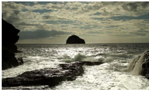
The Otolith Group, Hydra Decapita , 2010 00:31:41 h. Vídeo monocanal, color, so, 31 min 41 s Col·lecció MACBA.

Hydra Decapita evoca el món subaquàtic imaginat pel duo electrònic de Detroit Drexciya. Es tracta d'un món habitat pels descendents dels africans llançats al mar des dels vaixells d'esclaus, com el Zong , durant la travessia de l'Atlàntic o el «passatge intermedi» el 1781. Aquesta atrocitat es duia a terme amb l'objectiu de cobrar l'assegurança per la «càrrega» perduda en alta mar.