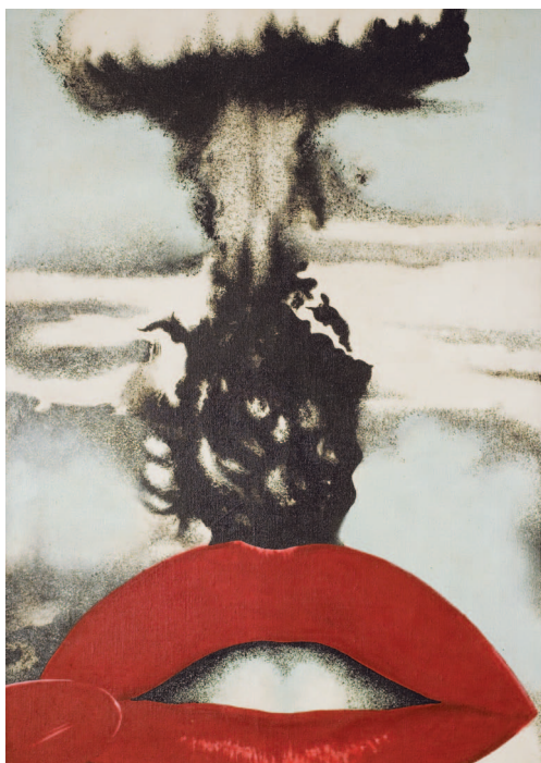
Joan Rabascall, Atomic Kiss [detall], 1968. Col·lecció MACBA. Dipòsit de l'Ajuntament de Barcelona. © Joan Rabascall, VEGAP, Barcelona, 2018.