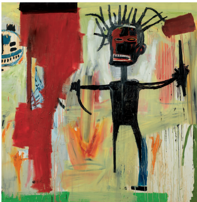
Jean-Michel Basquiat, Self Portrait [detalle], 1986. Colección MACBA. Depósito de la Generalitat de Catalunya. Antigua Colección Salvador Riera. Licencia de Artestar, Nueva York.