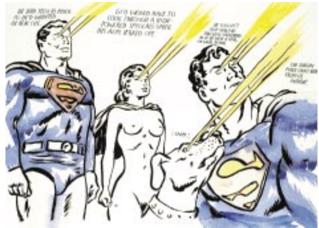
He had seen... , 1998. Col·lecció Dean Valentine i Amy Adelson, Los Angeles. Gentilesa Regen Projects, los Angeles. © Raymond Pettibon, 2002