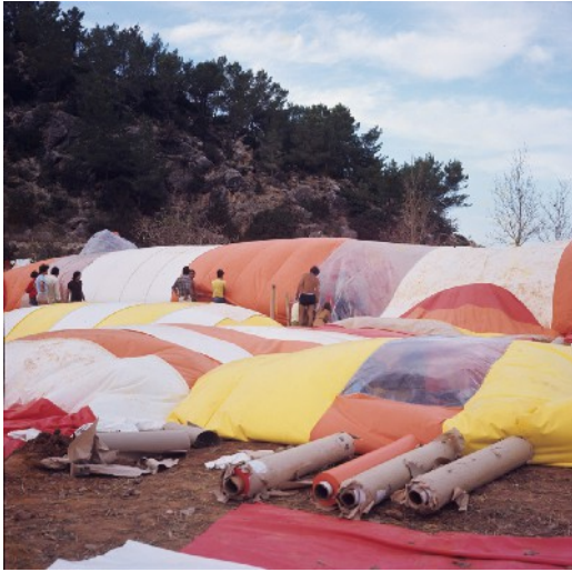
Instant City, 1971. Foto: Raimon Torres